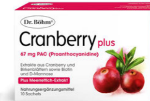
Cranberry plus Seite 24