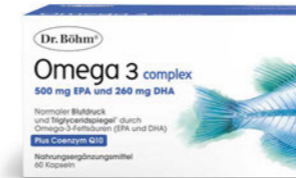
Omega 3 complex Seite 20