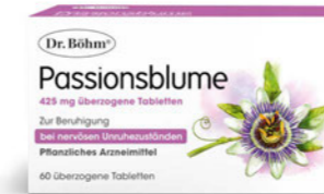
Passionsblume Seite 22