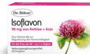
Isoflavon Seite 30