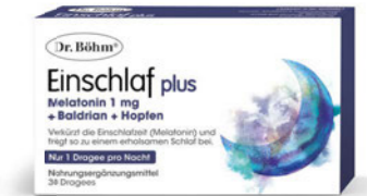
Einschlaf plus Seite 18