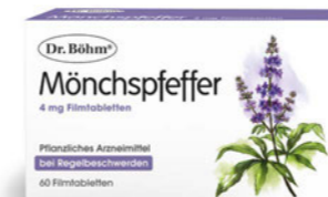
Mönchspfeffer Seite 28