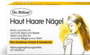
Haut Haare Nägel Seite 12