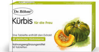
Kürbis für die Frau Seite 26