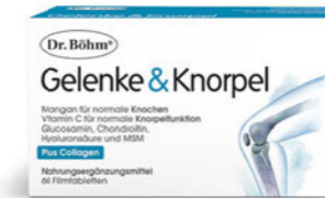
Gelenke & Knorpel Seite 14