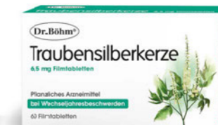
Traubensilberkerze Seite 30