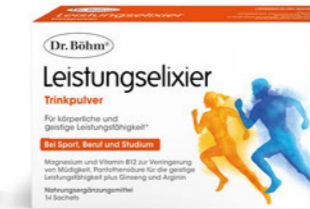
Leistungselixier Seite 16